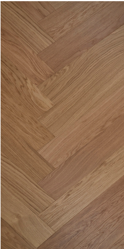
Eg Sildeben Innoplank natur Varenr.: 147100 DB nr.: 2301092